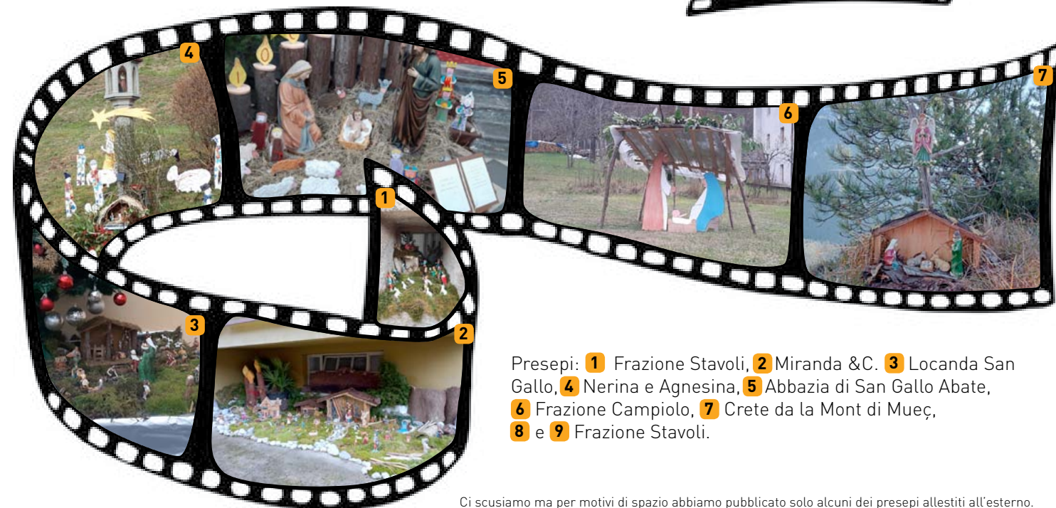
Presepi: 1 Frazione Stavoli, 2 Miranda & C. 3 Locanda San Gallo, 4 Nerina e Agnesina, 5 Abbazia di San Gallo Abate, 6 Frazione Campiolo, 7 Crete da la Mont di Mueç, 8 e 9 Frazione Stavoli.

Ci scusiamo ma per motivi di spazio abbiamo pubblicato solo alcuni dei presepi allestiti all'esterno.