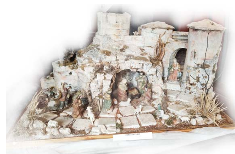
Presepe di Furio Corazza donato alla Pro Loco Moggese in occasione della 25ª edizione del Concorso Presepi "A Moggio la Stella"